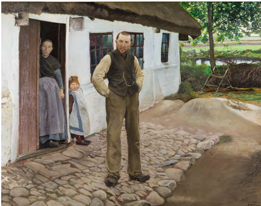
L.A. Ring (1854–1933): Husmandsfolk , 1897. Olie på lærred, 96×122 cm

Kropssprog er signaler, man udsender med sin krop, og som den, der kigger på en, kan opfatte som en slags information – dvs. ordløs kommunikation, hvor man 'taler' ved hjælp af f.eks. kropsholdning, ansigtsudtryk eller gestik.