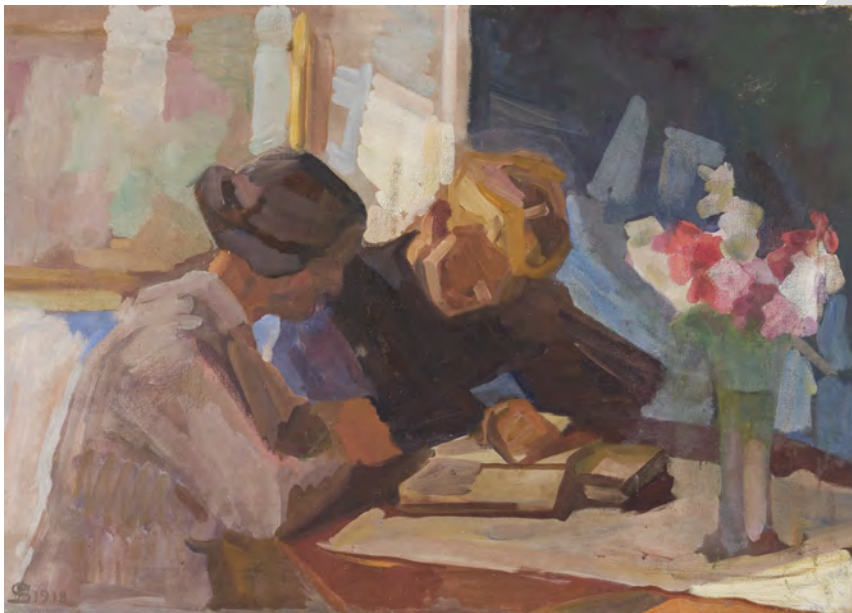
Fritz Syberg (1862–1939): Lektielæsning , 1918. Olie på lærred, 74×105 cm