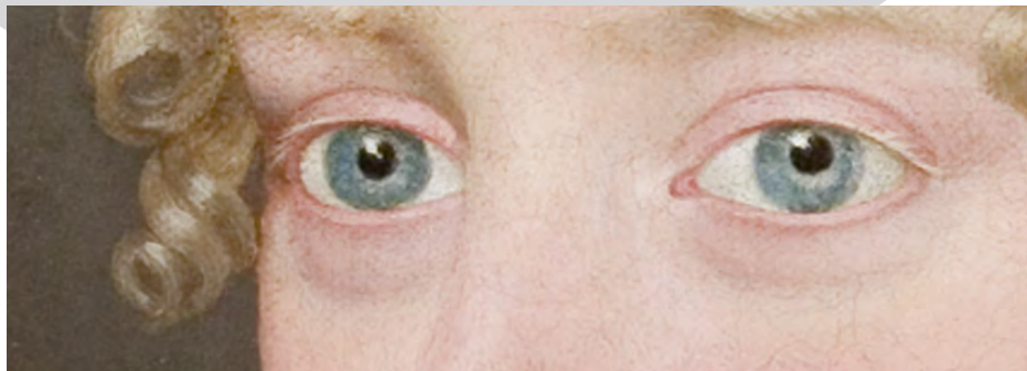
C.W. Eckersberg (1783–1853): Portræt af Kronprinsesse Caroline , 1819. Udsnit. Olie på lærred, 47×36,5 cm

I dette undervisningsmateriale skal I arbejde med hvordan I selv gerne vil 'ses' i jeres dagligdag, og 'portrætteres' når I lægger noget ud på de sociale medier. Hvilke roller spiller I – hvornår og overfor hvem? Hvilke kulisser, kostumer og rekvisitter bruger I i jeres selfies og familiefotos? Hvad deler I på de sociale medier, og hvad deler I ikke? Hvordan vil I gerne have, at jeres omverden ser jer, og hvad gør I, for at få det til at se sådan ud?