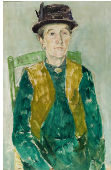
Kræsten Iversen (1886–1953): Kone med sort hat, 1922 Olie på lærred, 90x58,5 cm