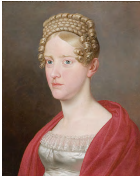
C.W. Eckersberg (1783–1853): Portræt af Kronprinsesse Caroline, 1819 Olie på lærred, 47x36,5 cm

Man kan altså, ved hjælp af kostumet, være en anden. Men der bruges også kostumer til teater og film, hvor tøjet er med til at understrege rollen eller karakteren.